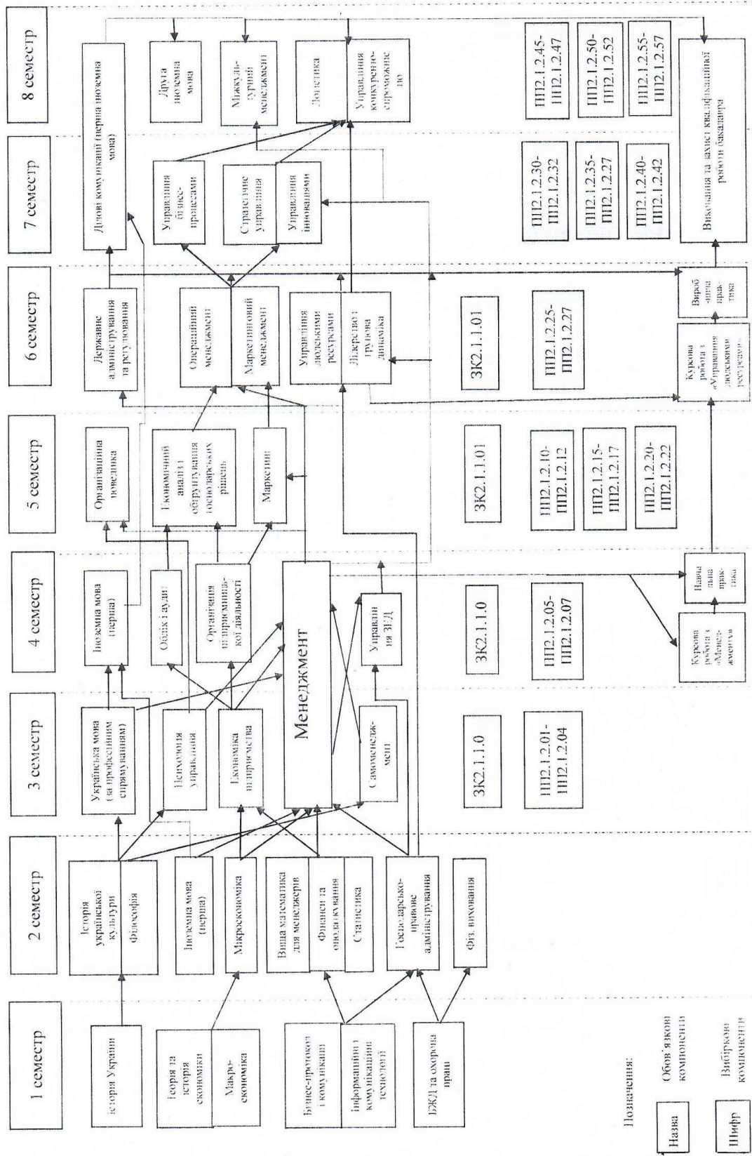
2.2. Структурно-логічна схема освітньої програми