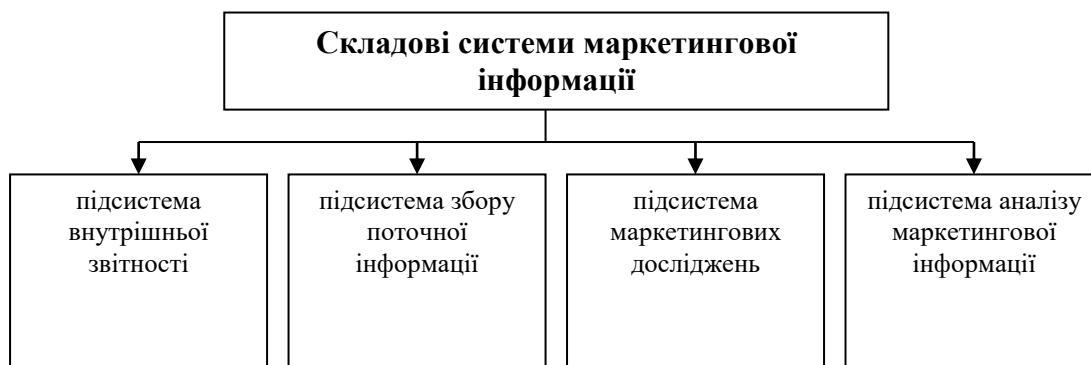
Рис. 3.2. Складові системи маркетингової інформації

Ілюстрації обов'язково мають назву, яку розмішують під нею. За необхідності під ілюстрацією розмішують пояснювальні дані (підрисунковий текст). Ілюстрація позначається словом «Рис. (номер рисунка)», яке разом з назвою ілюстрації розмішують після пояснювальних даних, наприклад: