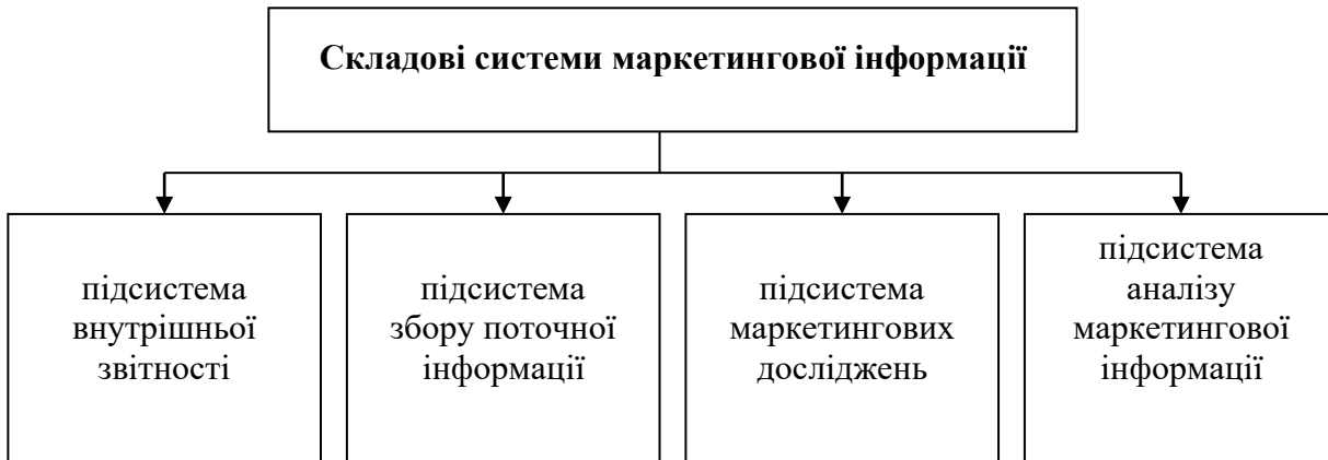
Рис. 3.2. Складові системи маркетингової інформації

Ілюстрації обов'язково мають назву, яку розміщують під ілюстрацією. За необхідності під ілюстрацією розміщують пояснювальні дані (підрисунковий текст). Ілюстрація позначається словом „Рис. (номер рисунка)”, яке разом з назвою ілюстрації розміщують після пояснювальних даних, наприклад: