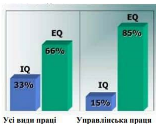
Рис.1.2. Вплив IQ та EQ на результати праці [13]

Високий рівень емоційного інтелекту є обов'язковою властивістю успішного лідера [2]. Так, за оцінками Гоулмана емоційний інтелект істотно важливіший від раціонального, особливо для менеджерів (рис. 1.2) [13].