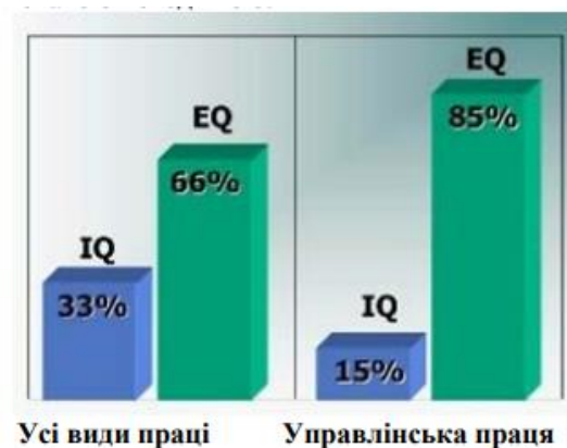
Рис.1.2. Вплив IQ та EQ на результати праці [13]

Високий рівень емоційного інтелекту є обов'язковою властивістю успішного лідера [2]. Так, за оцінками Гоулмана емоційний інтелект істотно важливіший від раціонального, особливо для менеджерів (рис. 1.2) [13].